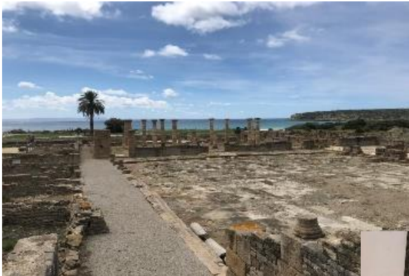
Romeinse overblijfselen Tarifa; op de achtergrond de Afrikaanse kust