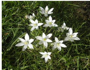
Gewone Vogelmelk (ornithogalum umbellatum)

Totaal verrast ontdekte Nico bij het voetbalveldje van de buurtkinderen een hem onbekend bloemetje. Met de smartphone, die tegenwoordig iedereen altijd bij zich draagt, probeerde hij de onbekende schoonheid te fotograferen,