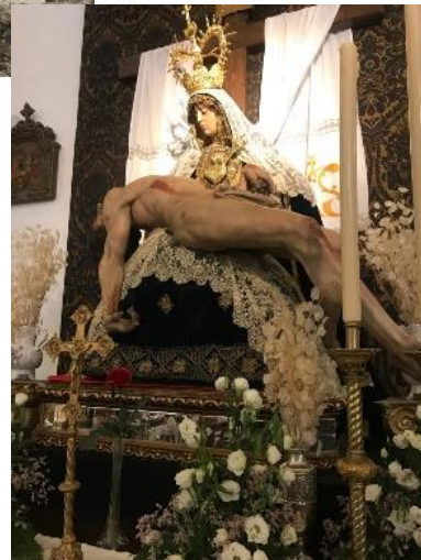
Iglesia Francesco de Assis, Tarifa