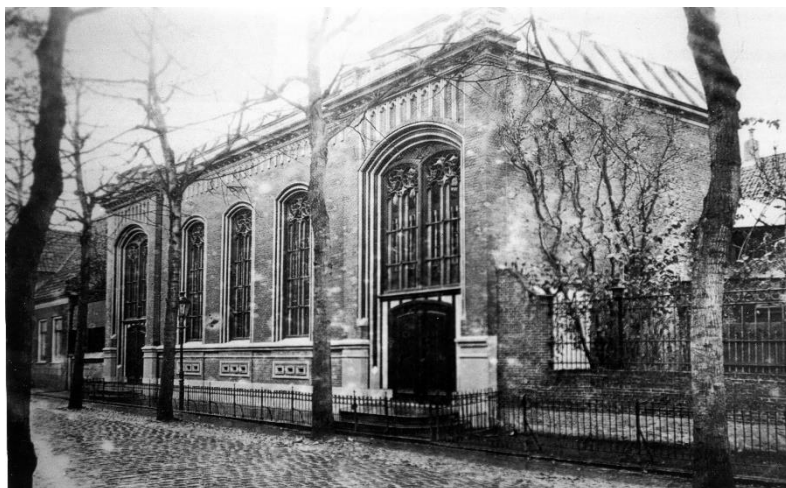
Evangelisch Lutherse kerk na 1879