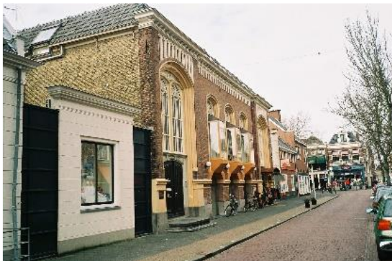
Voormalige Evangelisch Lutherse kerk Harlingen