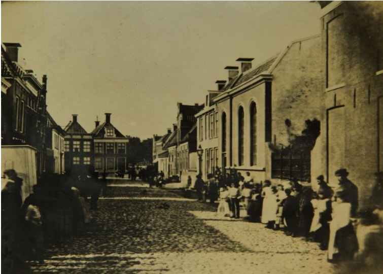
Rechts de oude kerk met pastorie rond 1870, voor de sloop en de herbouw