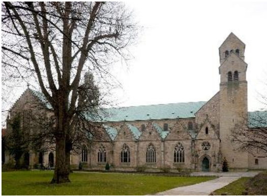
De Dom van Hildesheim

Deze mooie Romaanse kerk kent een hoofdingang met twee hoge, monumentale bronzen deuren met links een afbeelding uit het Evangelie en rechts uit het Oude Testament. Het bijzondere van deze Bernwardstür is dat beide afbeeldingen perfect in elkaar grijpen! De deuren zijn gemaakt in 1015.